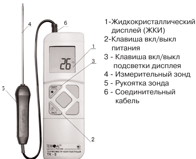
Рис. 1 Основные части прибора ТК -5.01 органы управления