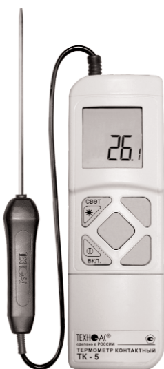
Рис. 2 ТК -5.01М