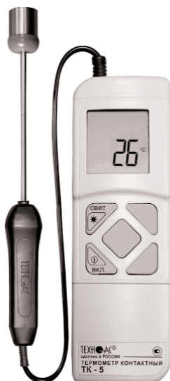
Рис.3 ТК -5.01П

Примечание - Место нанесения заводского номера находится под крышкой батарейного отсека, с тыльной стороны корпуса прибора.