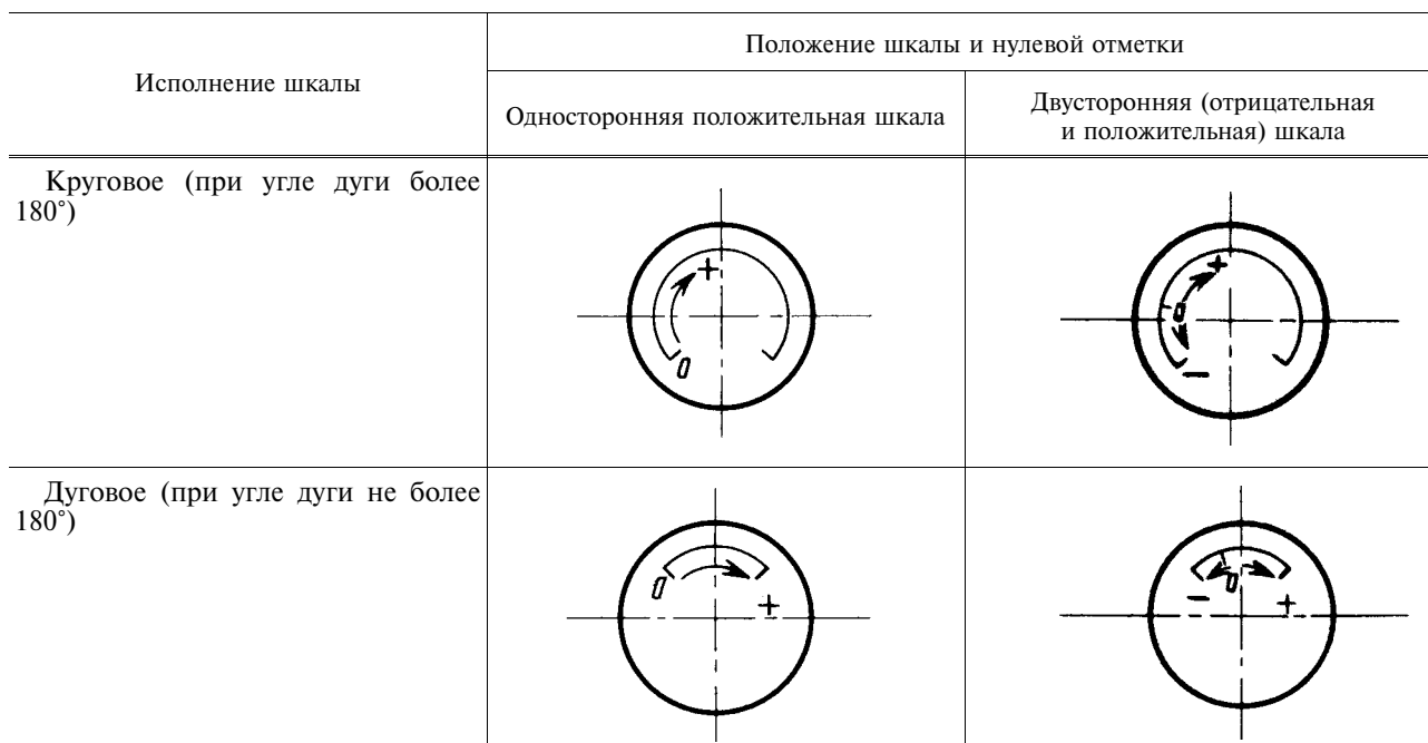
Т а б л и ц а 1

1.2. Исполнения шкалы должны соответствовать указанным в табл. 1.